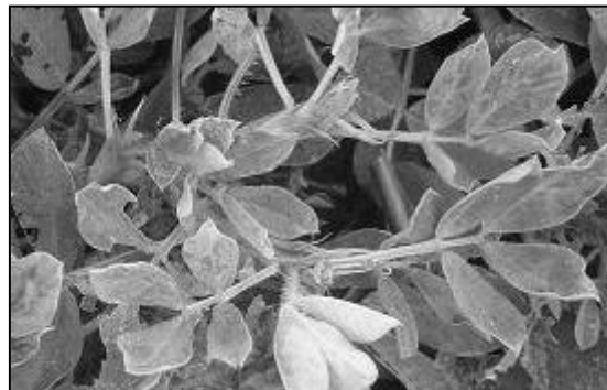
Foto 1. Planta de maní con moteado clorótico severo.

Por la modalidad de transmisión, la aplicación de insecticidas de contacto o sistémicos no es un método eficiente para controlar esta enfermedad.